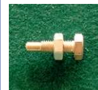
Bild 3: Durch die Verjüngung am Schraubenende lässt sich weicher abstimmen

Es gäbe noch bessere Möglichkeiten, aber diese sind zu aufwändig (Spreizung der Schraube bzw. der Gewindehülse). Nach dem Herausdrehen der Kurzschluss-Schraube habe ich in das Gewindeloch hineingeblasen und war erstaunt, dass sich dadurch die Leistung ein ganzes Stück verändert hat. Es fallen wohl kleinste Metallteilchen